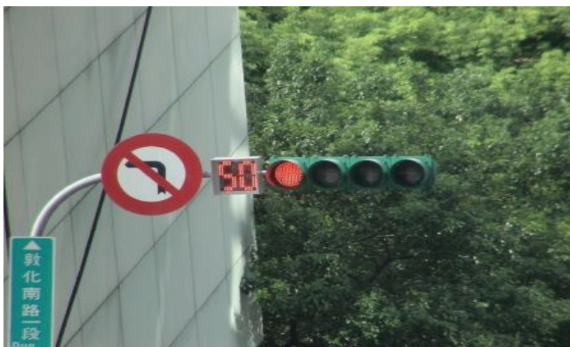
圖一 行車倒數計時顯示器

在此趨勢下，作為首都的臺北市政府過去曾首創許多新穎的政策措舉，而有所謂「臺北經驗」對外擴散與移植之現象，例如 1994 年臺北捷運系統、戶政事務所奉茶服務，1995 年垃圾不落地政策，1999 年行人倒數計時器， 1 2000 年垃圾費隨袋徵收政策，2002 年整合捷運與市區聯營公車的悠遊卡系統，以及 2008 年啓用的 1999 市民熱線。其中有些是向國外取經所引進，如臺北市政府曾派員前往韓國觀摩垃圾費隨袋徵收制度之運作，以及參考美國紐約市政府 311 專線的營運經驗；也有像行人倒數計時器這樣世界首創而引發國內外各城市前來師法的新潮措舉。但是在行車倒數計時顯示器（參見圖一）的設置上，臺北市政府的態度卻顯得相對保守，在其他縣市實施六年之久才正式跟進。此次臺北市政府除了不再扮演國內首創縣市的角色，是以學習者的身分從其他縣市學習、移植這套制度，特別是一向予人創新印象的臺北市過去往往是其他縣市學習之標竿，而今則為後進的學習者，在政策學習與移植的過程之中應當別具深厚的意義。